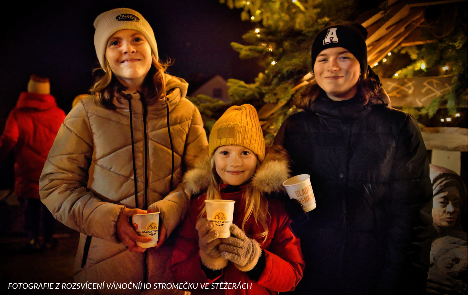
FOTOGRAFIE Z ROZSVÍCENÍ VÁNOČNÍHO STROMEČKU VE STĚŽERÁCH