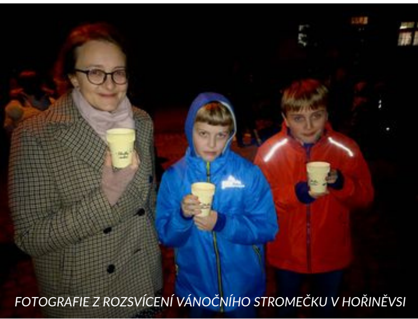
FOTOGRAFIE Z ROZSVÍCENÍ VÁNOČNÍHO STROMEČKU V HOŘINĚVSI